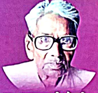
स्व. यादवरावजी पेश्करीवार संस्थापक